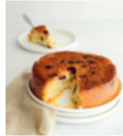
S. 46: Reiskuchen mit Orangenblütenwasser