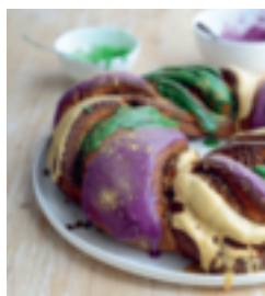
S. 170: King Cake