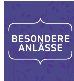
S. 133: Kapitel 4 – Besondere Anlässe