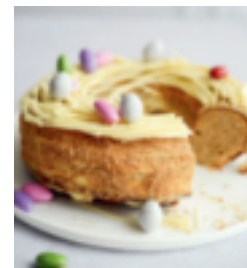
S. 138: Osternest-Kuchen