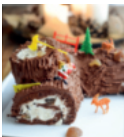
S. 169: Bûche de Noël aux Marrons