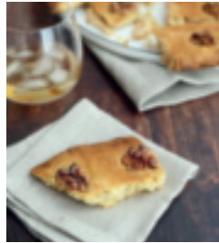
S. 50: Broyé du Poitou