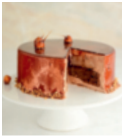
S. 97: Haselnusstorte