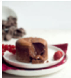
S. 57: Schokoladenkuchen mit flüssigem Kern