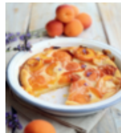
S. 41: Clafoutis mit Aprikosen und Lavendel