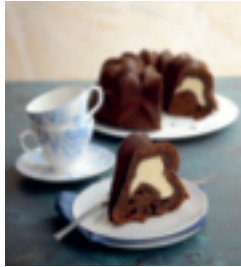
S. 21: Marmorkuchen mit Käsekuchenfüllung