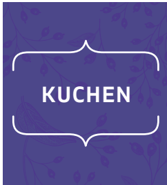
S. 18: Kapitel 1 – Kuchen