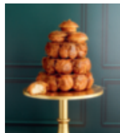
S. 81: Windbeutelkuchen mit Maronenfüllung