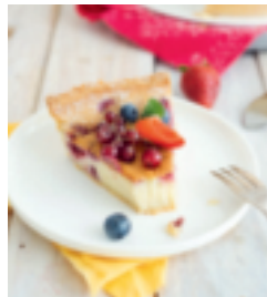
S. 131: Flan pâtissier