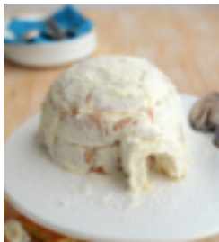
S. 157: Iglu-Kuchen