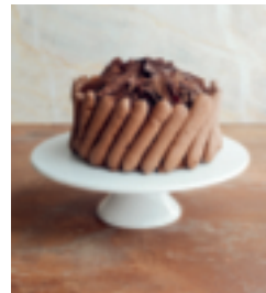
S. 109: Concorde