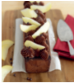
S. 26: Schokoladen- kuchen mit Äpfeln