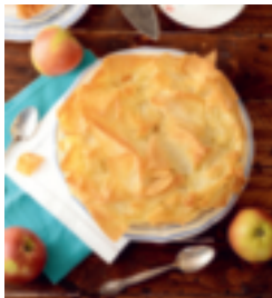
S. 128: Croustade