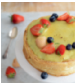
S. 85: Crème-brûlée-Torte