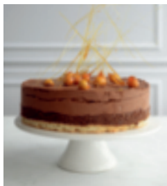
S. 112: Trianon oder Royal – Schokoladentorte