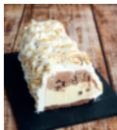
S. 94: Eistorte – »Omelette norvégienne«