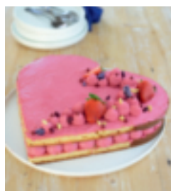
S. 142: Herztorte zum Muttertag