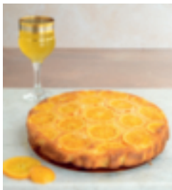
S. 37: Vite fait à l'orange