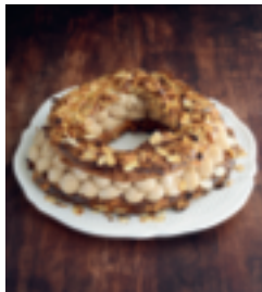
S. 98: Paris-Brest