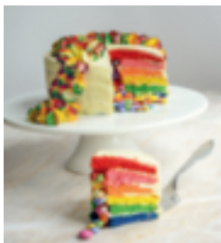
S. 134: Faschingstorte