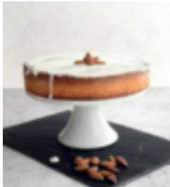
S. 54: Fondant aux amandes