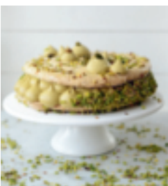
S. 90: Succès mit Pistazien