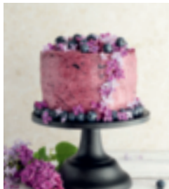
S. 70: Blaubeertorte