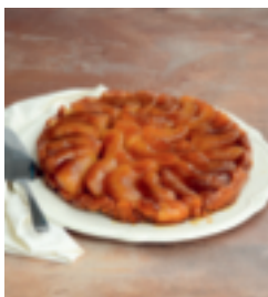
S. 116: Tatin aux pommes – Apfeltarte