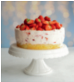
S. 69: Erdbeertorte