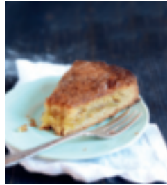
S. 45: Gâteau breton Bretonischer Kuchen