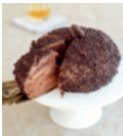
S. 110: Béret-basque-Torte