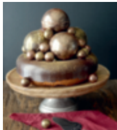
S. 158: Weihnachtskugel-Kuchen