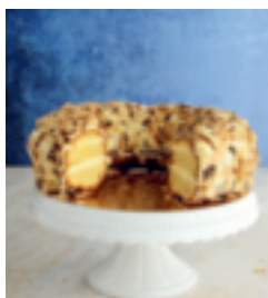
S. 93: Pariser Kranz