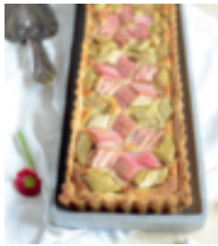
S. 124: Rhabarber-Tarte graphique