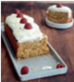
S. 33: Gesunder Haferflockenkuchen