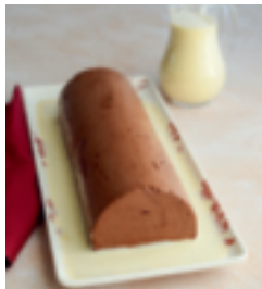
S. 106: Marquise au chocolat