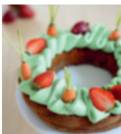
S. 141: Möhrenkuchen