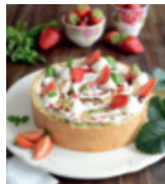
S. 62: Biskuitrollentorte mit Erdbeeren & Basilikum