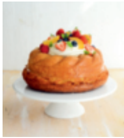
S. 25: Savarin