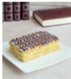
S. 89: Mille-feuille