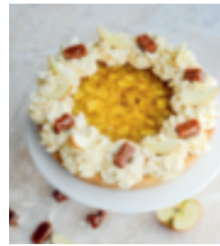
S. 127: Salzbutterm-Karamell-Tarte