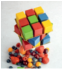
S. 149: Zauberwürfel-Kuchen