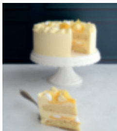
S. 77: Zitronentorte