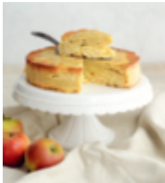
S. 30: Apfelkuchen ohne Boden