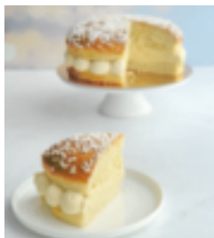
S. 86: Saint-Tropez-Torte