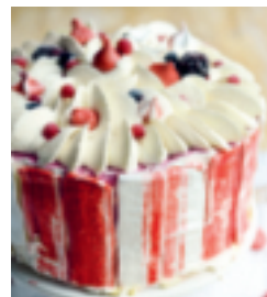
S. 166: Vacherin-Torte