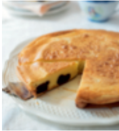
S. 42: Far breton mit Buchweizenmehl