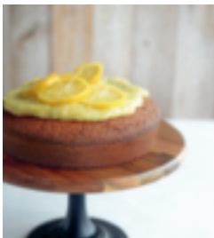
S. 38: Zitronen-Mohn- Kuchen