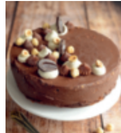
S. 58: Extraschokoladiger Marmorkuchen