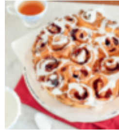
S. 22: Chinois mit Obst