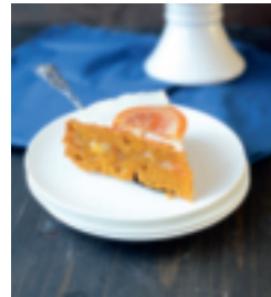
S. 34: Süßkartoffelku- chen mit Vitaminen