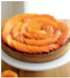
S. 123: Aprikosen-Kokosnuss-Tarte