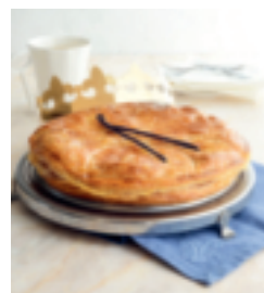
S. 173: Galette des Rois