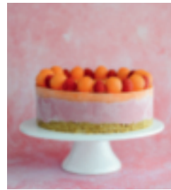
S. 73: Himbeer-Melonen-Torte