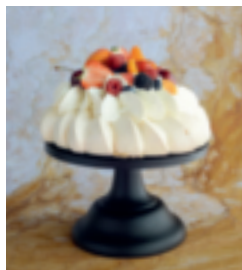
S. 165: Pavlova-Torte