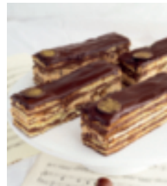
S. 101: Opéra-Torte mit Nussnougat