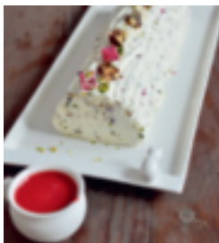
S. 162: Nougat glacé