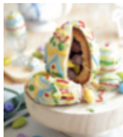
S. 137: Ostereier-Kuchen