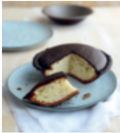
S. 49: Tourteaux fromager