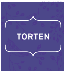
S. 60: Kapitel 2 – Torten