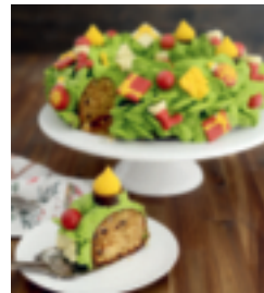
S. 161: Adventskranz-Kuchen