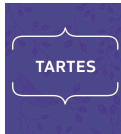
S. 114: Kapitel 3 – Tartes