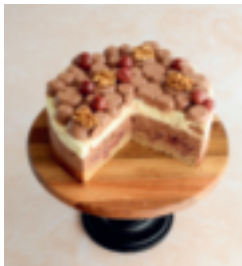
S. 105: Eierlikörtorte