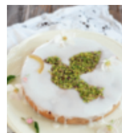
S. 146: Pfingstkuchen – »Le Colombier«