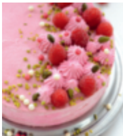
S. 74: Joconde-Torte mit Himbeeren und Pistazien