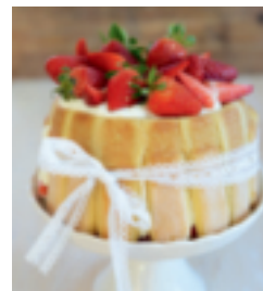
S. 66: Charlotte mit Erdbeeren