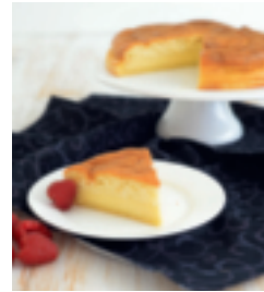
S. 53: Matschepampenkuchen