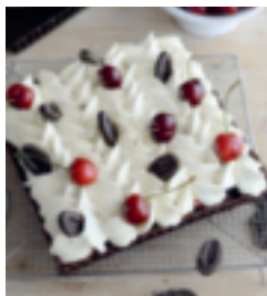
S. 119: Schwarzwälder-Kirsch-Tarte