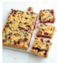
S. 120: Deutsch-französische Tarte mit Pflaumen