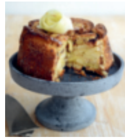
S. 29: Charlotte aux pommes (Apfel-Charlotte)