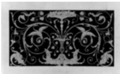
Oben: Zwei der schwarzweißen Abbildungen aus Ernst Haeckels Kunstformen der Natur : »Schlangensterne« und »Motten«, Lithographien von Adolf Giltch nach Zeichnungen Haeckels Unten: Musterzeichnung von Ulrich Rorschach