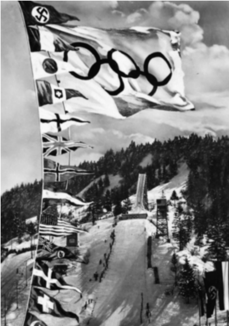
Die Große Olympiaschanze in Garmisch-Partenkirchen im Jahr 1936.

schließlich wieder an Deutschland – doch auch hier befand man sich seit September 1939 im Krieg, und so mussten die Olympischen Winterspiele 1940 ausfallen.