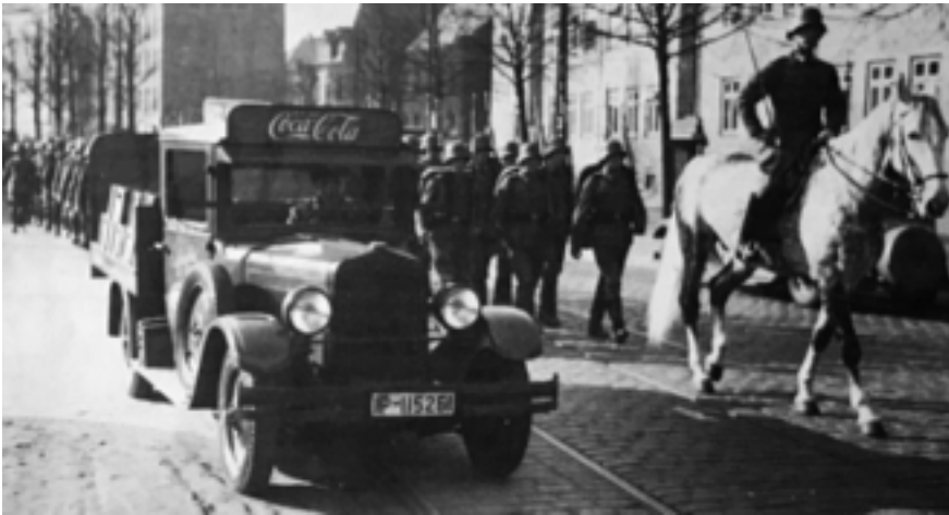
Coca-Cola zieht mit in den Krieg (Deutschland 1939)

Während in Großbritannien die Produktion von Cola kriegsbedingt frühzeitig eingestellt werden musste, reichte der Vorrat an Ingredienzen im Deutschen Reich erstaunlicherweise noch bis in das Jahr 1942 hinein. Seit der Einführung auf dem deutschen Markt hatte der Konzern stets versucht, Coca-Cola nicht unbedingt als amerikanisches, sondern als deutsches Erfrischungsgetränk zu präsentieren. – Hierzu passt eine häufig überlieferte Anekdote: Als deutsche Kriegsgefangene in den USA von Bord eines Schiffes gingen, wurden heimatliche Gefühle in ihnen geweckt. Denn erstaunt stellten sie fest: Coca-Cola gibt es auch in Amerika!