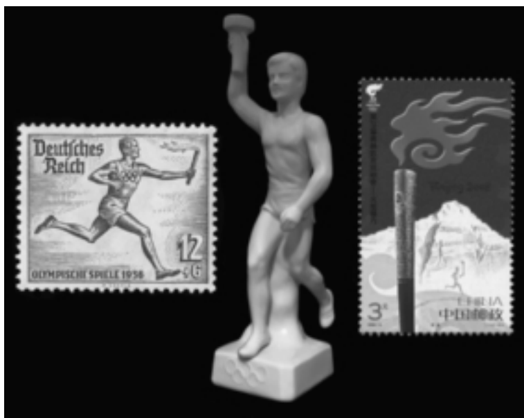
Olympische Fackelläufe gibt es erst seit 1936. Deutsche Briefmarke aus dem Jahr 1936, Porzellanfigur um 1960, chinesische Briefmarke aus dem Jahr 2008.

Ob in London, Rio de Janeiro oder Tokio – durch den Fackellauf vom griechischen Olympia zum jeweiligen Austragungsort erhalten die Spiele einen Auftakt, wie er feierlicher kaum sein kann. Der Fackellauf und das Entzünden des Feuers sind heute bei Olympischen Spielen ebenso selbstverständlich wie