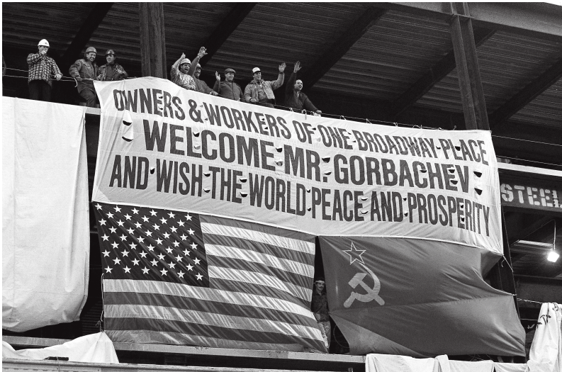
»Gorbi-Manie« in Manhattan

Siebter Dezember 1988. Manhattan war in heller Aufregung an diesem Abend. Tausende New Yorker und Touristen säumten die Straßen hinter den Polizeisperren, jubelten, winkten und reckten die Daumen hoch, als Michail Gorbatschow in einem Korso von 47 Autos den Broadway hinunterrollte.