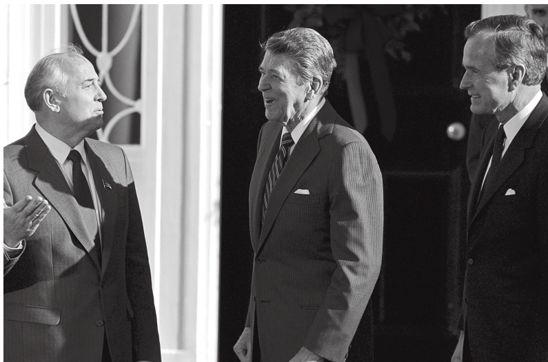
Der Mann am Rande des Geschehens: George H. W. Bush

gegeben und zu diesen Themen Bemerkungen oder Vorschläge zu machen hat, würde ich sie gerne hören.« Wieder ließ sich Bush zu nichts hinreißen. Am Ende machte Gorbatschow nur noch den Witz, es sei das »Wichtigste, dem nächsten Präsidenten das Leben leichter zu machen.« 30